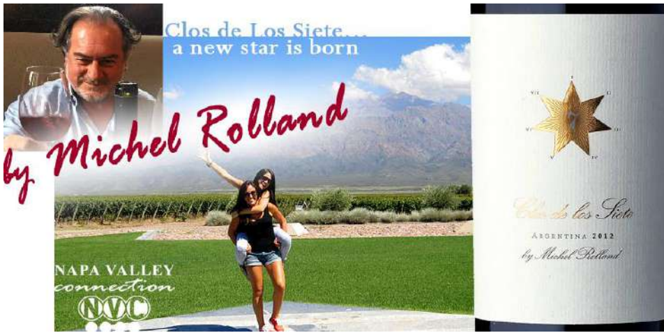
Clos de Los Siete - Argentina by Michel Rolland,